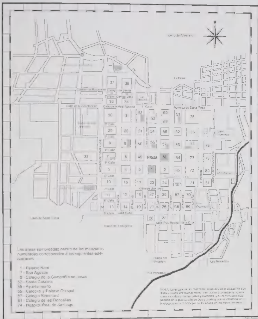
Mapa de la Ciudad de Santiago de Guatemala